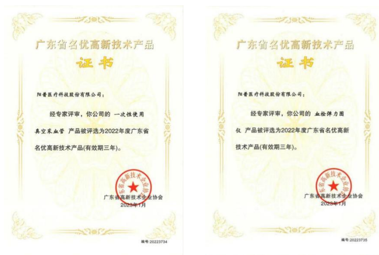
广东省名优高新技术产品证书

报告期内，公司主营产品“一次性使用真空采血管”及“血栓弹力图仪”被广东省高新企业协会评为“2022 年度广东省名优高新技术产品”。《广东省名优高新技术产品证书》的取得是对公司研发实力、持续创新能力、科技成果转化能力及企业成长性的肯定，有助于公司发挥战略优势，提升产品附加值，增加市场信任度，并形成持续创新机制。